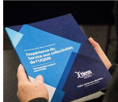
Lancement de la monographie en novembre 2018